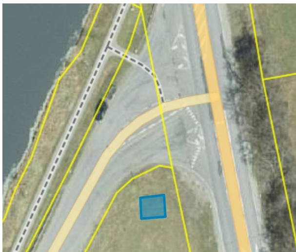
Joonis 1. Skulptuuri soovitud asukoht, väljavõte ehitisregistrist (ruumikuju)