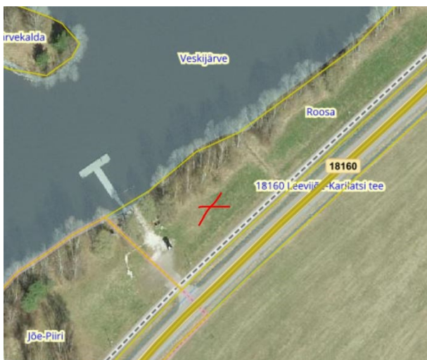
Joonis 3. Skulptuuri soovituslik asukoht, väljavõte Maa- ja Ruumiameti geoportaalist

Alternatiivse lahendusena soovitame skulptuuri paigaldada riigitee kaitsevööndisse riigitee nr 18160 ja järve vahelisele alale Roosa kinnistule (katastritunnus 87202:001:0322) (Joonis 3), kuhu on skulptuuri juurde pääsemiseks tagatud juurdepääs nii kergliiklusteelt kui ka autodega liiklejatele (autod ei pea peatuma riigitee servas, vaid saavad parkida ujumiskoha parklas).